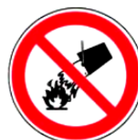
2.4. nedzēst ar ūdeni