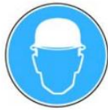
6.2. jālieto aizsargķivere