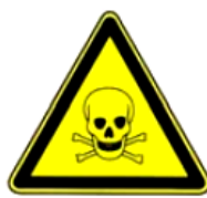
4.3. toksiska viela