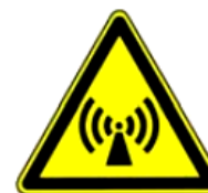
4.12. nejonizējoša radiācija vai starojums