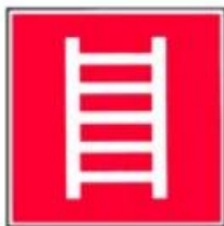
Ugunsdzēsības un glābšanas kāpnes