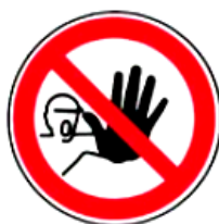
2.6. nepiederošām personām kustība aizliegta