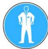
6.7. jālieto aizsargkostīms