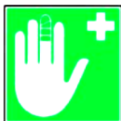
8.6. pārsiešanas līdzekļi