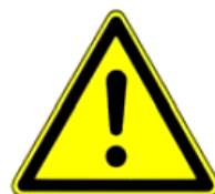
4.9. vispārēja bīstamība