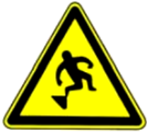
4.21. uzmanību, pakāpiens