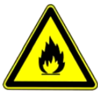
4.1. degoša viela vai ugunsbīstama telpa