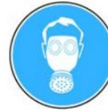
6.4. jālieto gāzmaska, respirators