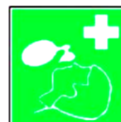
8.8. atdzīvināšanas līdzekļi