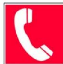
Tālrunis ugunsdzēsības un glābšanas dienesta izsaukšanai

Virzieni uz ugunsdzēsības iekārtu un līdzekļu atrašanās vietu