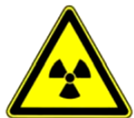
4.5. radioaktīvā viela vai jonizējošs starojums