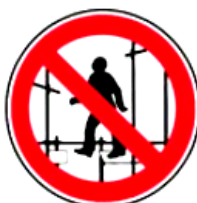
2.11. sastatņu montāža