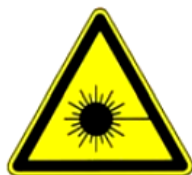
4.10. lāzera stars