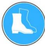
6.5. jālieto darba apavi