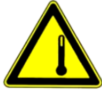
4.26. augsta temperatūra