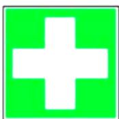
8.1. pirmās palīdzības punkts

4. pirmās palīdzības, evakuācijas izeju un glābšanas papildizeju zīme - zīme, kas sniedz informāciju par pirmās palīdzības sniegšanas vietām, evakuācijas izejām un glābšanas papildizejām;