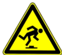
4.14. uzmanību, šķēršļi