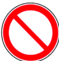
2.9. aizliegts (ar skaidrojošo uzrakstu)