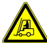
4.7. iekšējais transports