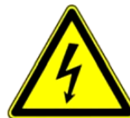
4.8. bīstami, elektrība