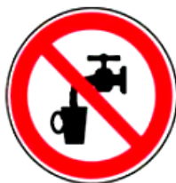
2.5. nav dzerams