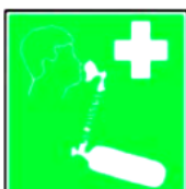
8.5. elpošanas līdzekļi