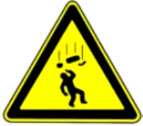
4.25. uzmanību, krītoši objekti