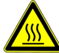
4.27. uzmanību, karsta virsma