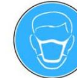
6.12. jālieto sejas maska