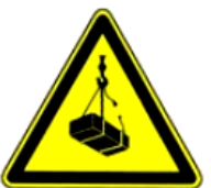
4.6. uzmanību, pacelta krava