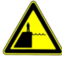
4.23. dziļš ūdens