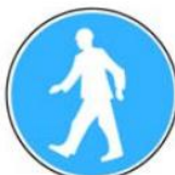
6.13. gājēju ceļš (maršruts)