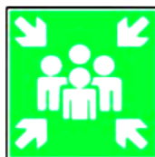
8.7. droša pulcēšanās vieta