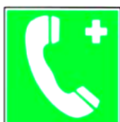
8.9. tālrunis neatliekamās medicīniskās palīdzības izsaukšanai