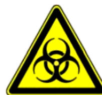
4.16. bioloģiskais risks