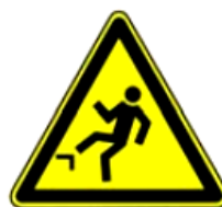
4.15. uzmanību, nelīdzens