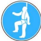
6.9. jālieto aizsargjosta