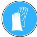
6.6. jālieto aizsargcimdi