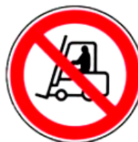
2.7. iekšējā transporta kustība aizliegta