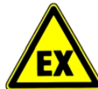
4.19. eksplozīva vide