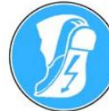
6.11. jālieto antistatiski apavi