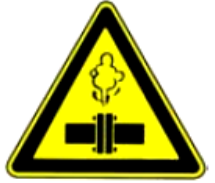
4.28. uzmanību, karsts tvaiks