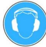
6.3. jālieto dzirdes aizsardzības līdzekļi