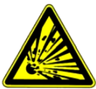
4.2. eksplozīva viela vai sprādzienbīstama telpa