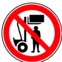
2.10. nestāvēt zem kravas