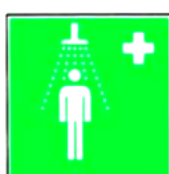
8.3. sanitārā apstrāde