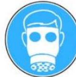
6.10. jālieto respirators