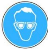
6.1. jālieto aizsargbrilles