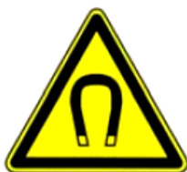
4.13. spēcīgs magnētiskais lauks