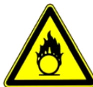
4.11. oksidējoša viela