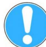
6.14. vispārīgā rīkojuma zīme (lieto kopā ar citām zīmēm)