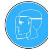
6.8. jālieto sejas aizsardzības līdzekļi