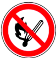
2.2. smēķēšana un atklāta liesma aizliegta