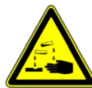
4.4. kodīga viela