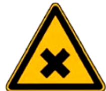
4.18. kaitīga vai kairinoša viela*