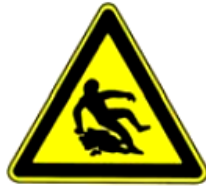
4.22. uzmanību, slidens