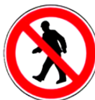
2.3. gājēju kustība aizliegta