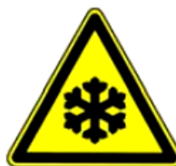
4.17. zema temperatūra